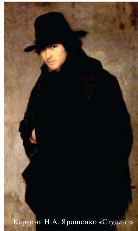
Картина Н.А. Ярошенко «Студент»